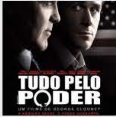
Tudo pelo Poder