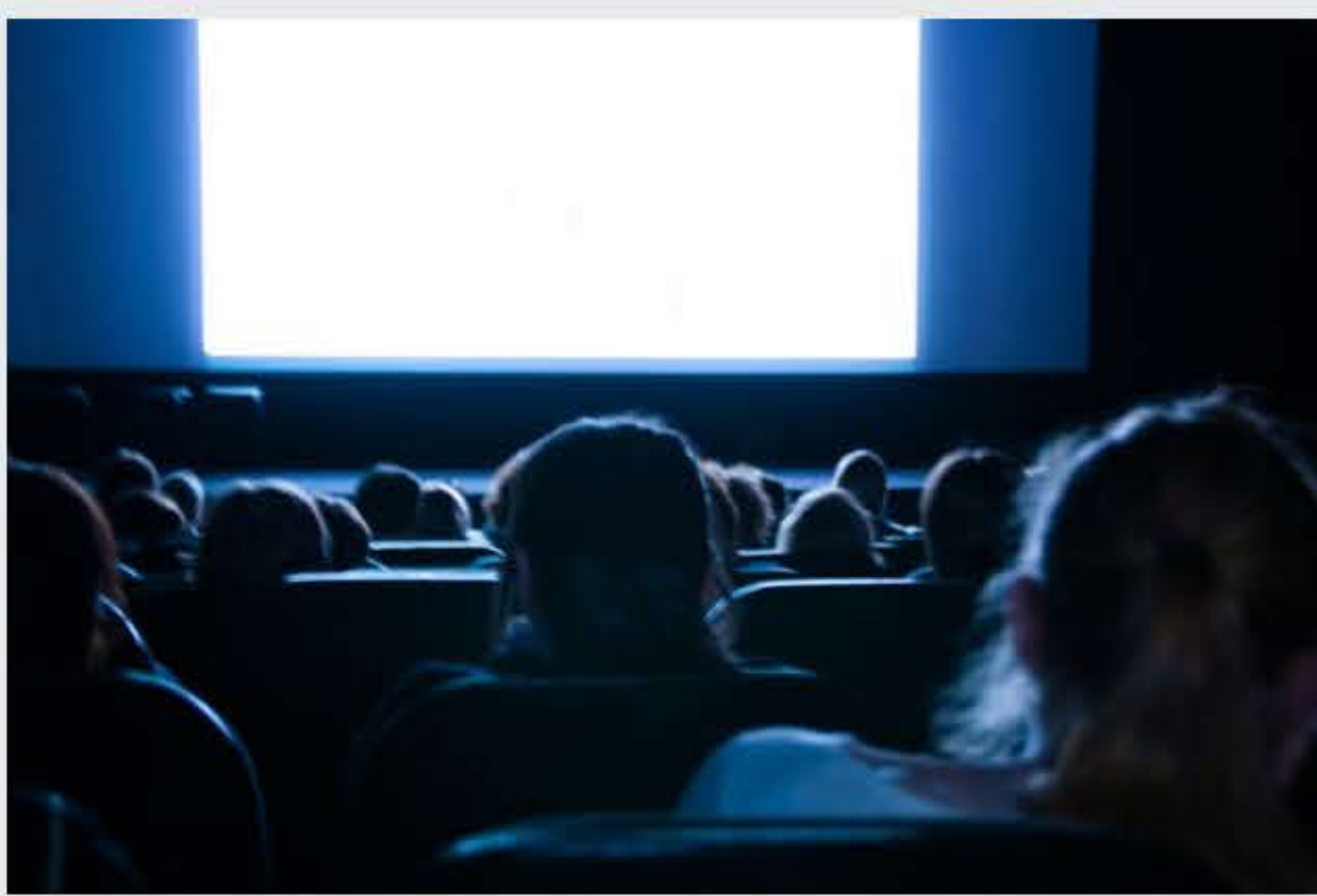
Filmes podem servir de inspiração e motivação para muitos profissionais.

Você alguma vez já assistiu a algum filme que lhe deu um novo olhar sobre determinado assunto e renovou suas forças para lutar pelas suas metas? Saiba que este é um dos poderes da sétima arte. Além de entreter, os personagens, quando causam empatia, fazem com que nos coloquemos no lugar deles e passemos a enxergar novas soluções para problemas pessoais e profissionais.