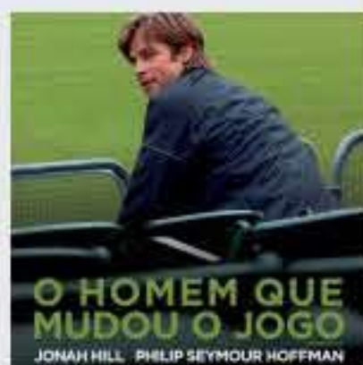
O Homem que Mudou o Jogo