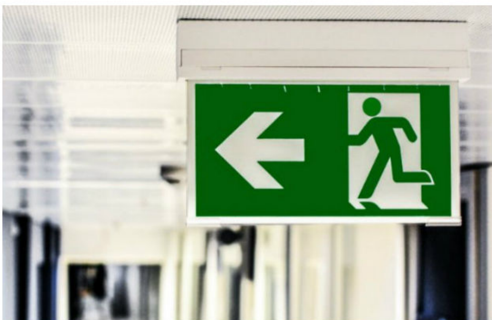
Indecisão: como ter certeza se está preparado para uma promoção de cargo

Como saber se vale a pena mudar de emprego e de empresa? Ou como ter certeza se está preparado para uma promoção de cargo?