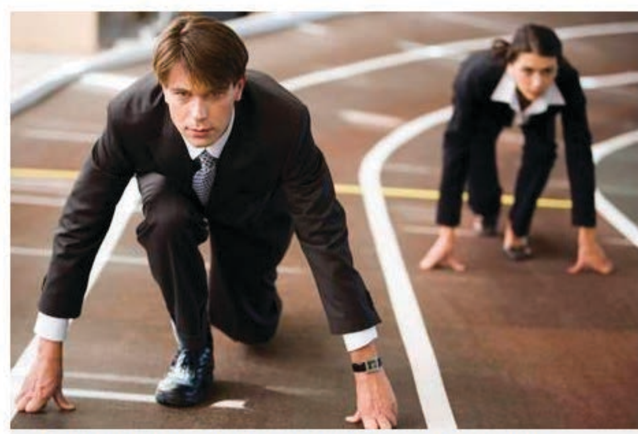
Competitividade não dever ser confundida com a competição